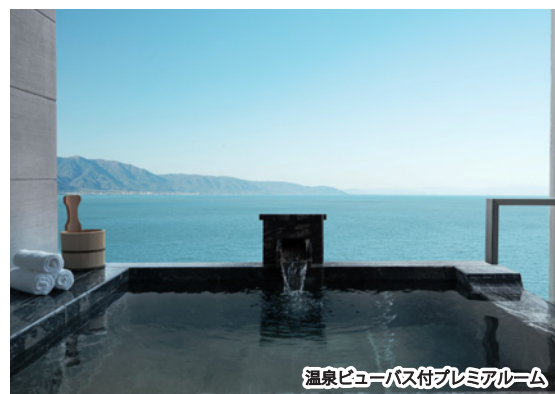
温泉ビューバス付プレミアルーム

選べるお部屋は2種類。「温泉ビューバス付プレミアルーム」では、温泉に浸かりながら びわ湖の絶景をご覧いただけます。そして「温泉付プレミアルーム」は、びわ湖の景色を 滞在しただけでもご覧いただけ、お部屋の温泉もお楽しみいただけるタイプのお部屋です。 ※「温泉付プレミアルーム」のお風呂はビューバスではございませんので、ご予約時ご注意ください。