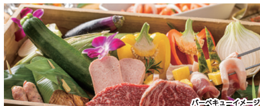
バーベキューイメージ