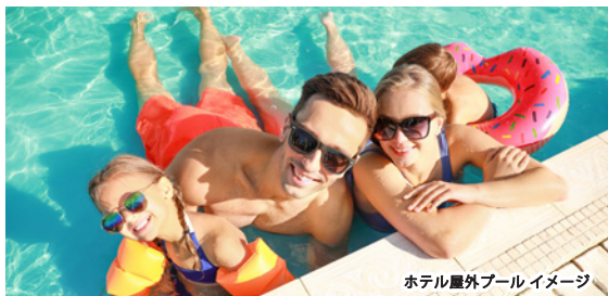
ホテル屋外プールイメージ

人気のジャイアントパンダを間近に感じられたり、感動のマリンライブや、広大なサファリワールドなど大人も子供も1日中楽しめます。 (ホテルより車で約10分)