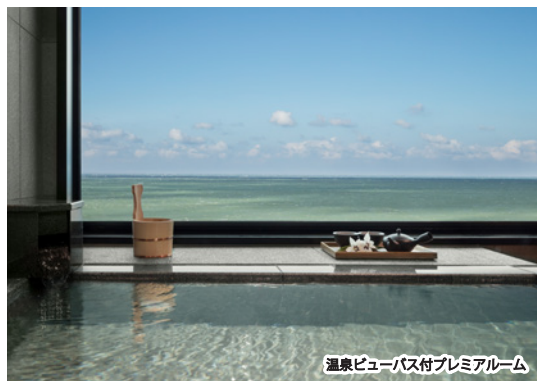
温泉ビューバス付プレミアムルーム