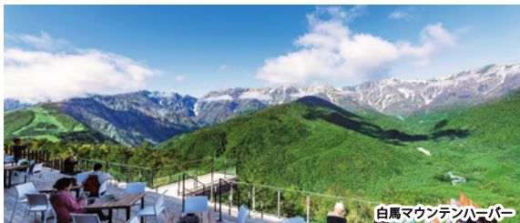
白馬マウンテンハーバー

白馬八方尾根の中腹、標高1,200mに位置し、雄大な北アルプスや白馬の山々を目の前に望む絶景スポット。リフト1本で気軽に訪れることができます。(ホテルよりリフト乗り場まで車で約15分)