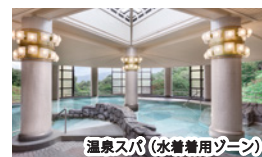
温泉スパ(水着着用ゾーン)