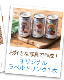
お好きな写真で作成！ オリジナル ラベルドリンク1本