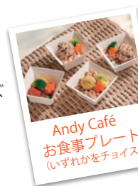
Andy Cafe お食事プレート (いづれかをチョイス)