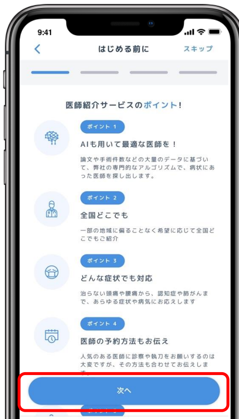
クリンタル ホーム画面