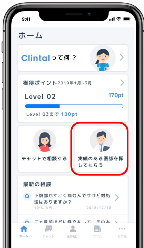
クリンタル ホーム画面