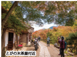
とがの木茶屋付近

※旅行代金には宿泊費、食事代(夕・朝・昼食 各1回)、ガイド代、ツアー中の移動費、保険料、宿泊にかかわるサービス料、消費税が含まれます。