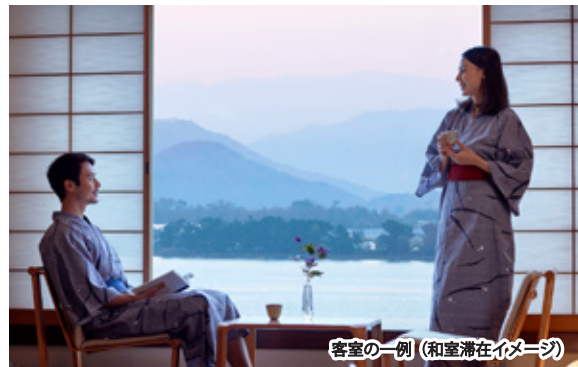
客室の一例 (和室滞在イメージ)