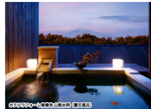
ホテルラフォーレ修善寺山紫水明（静岡県）