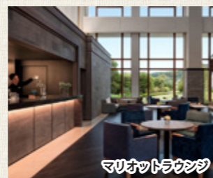
マリオットラウンジ