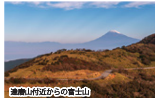
達磨山付近からの富士山