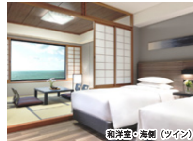
和洋室・海側（ツイン）

名湯・白浜温泉をホテル最上階の貸切温泉風呂で、太平洋の大パノラマを眺めながら存分にお楽しみください。ご宿泊のお部屋はゆったりとおくつろぎいただける和室を備えた和洋室タイプをご用意いたします。小さなお子様連れのファミリーにも人気のプランです。