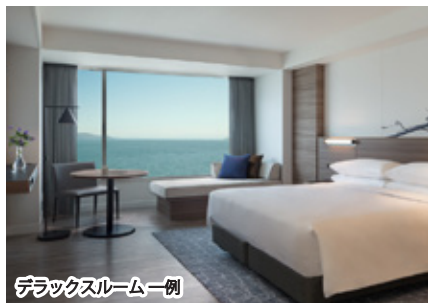
デラックスルーム一例