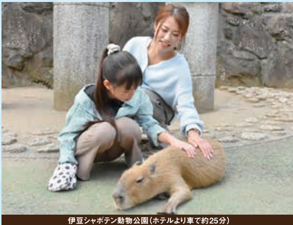
伊豆シャボテン動物公園(ホテルより車で約25分)