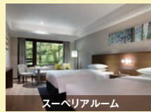
スーペリアルーム