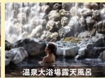
温泉大浴場露天風呂