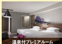
温泉付プレミアムルーム