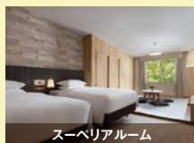
スーペリアルーム