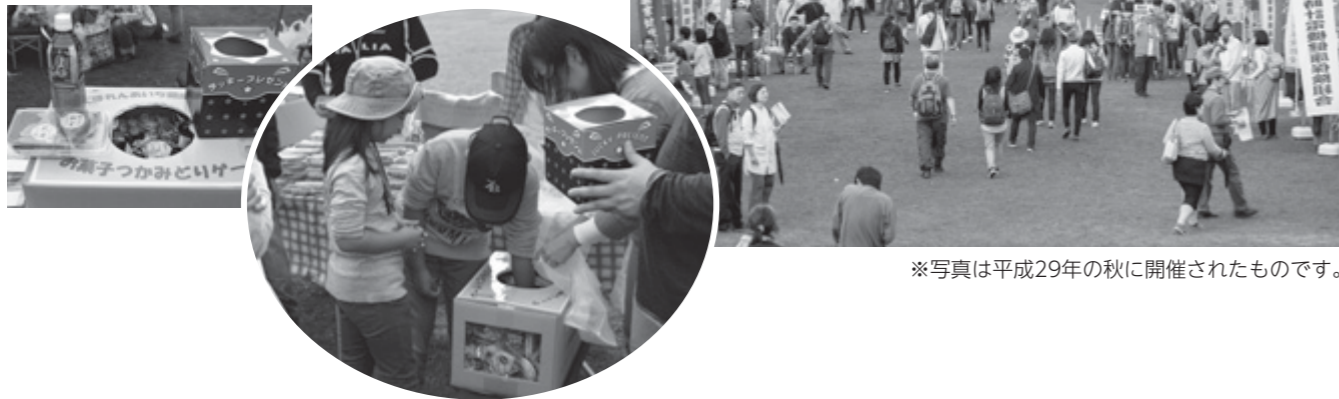
※写真は平成29年の秋に開催されたものです。